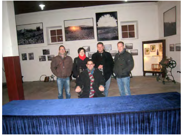
Slika 3: Obisk kraljeve viske kleti.

Kot je bilo omenjeno na začetku prispevka, smo proste urice med obiskom Beograda izkoristili za ogled posebnosti tega velikega mesta oziroma okolice. Tako smo si ogledali še kraljevsko vinsko klet z mavzolejem.