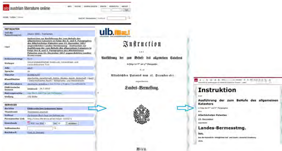
Slika 2: Primer dostopa do besedila Instrukcije za izvajanje splošnega katastra iz leta 1824 v slikovni in nelektorirani tekstovni obliki na spletni strani Austrian Literature Online

v originalni slikovni obliki skeniranih dokumentov in v osnovni nepregledani tekstovni obliki OCR. Primer dostopa do takega prikaza je na sliki 2.