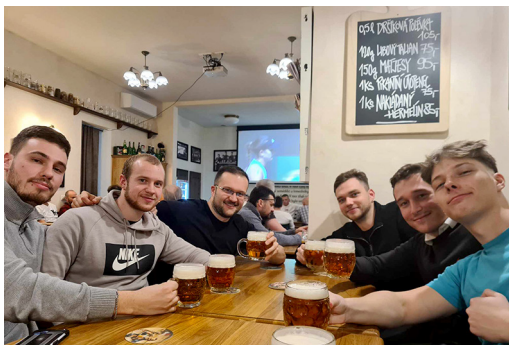
Slika 1: Obisk pivnice v Brnu