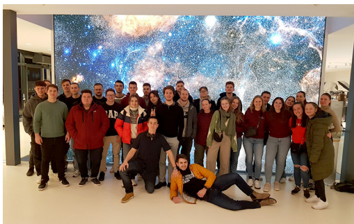
Slika 3: Obisk planetarija v Brnu