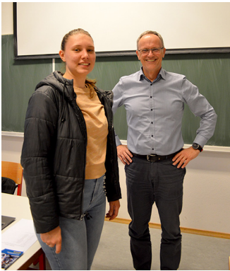
Slika 5: Hitri zmenki s podjetjem LGB d.o.o.