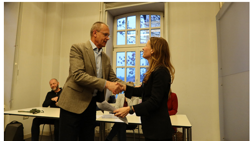
Sliki 2 in 3: »Predaja poslov« – dotedanji predsednik sem v imenu prisotnih čestital novo izvoljeni predsednici.

Nova predsednica se je zahvalila za zaupanje, predstavila program dela za leto 2024 in člane povabila k čim številčnejši udeležbi na aktivnostih društva. Po končanem uradnem delu zбора pa je prisotne povabila na nadaljevanje druženja in neformalno izmenjavo mnenj ob prigrizku, kjer smo v polnem številu do poznih večernih ur kovali zamisli za nadaljnje delovanje.