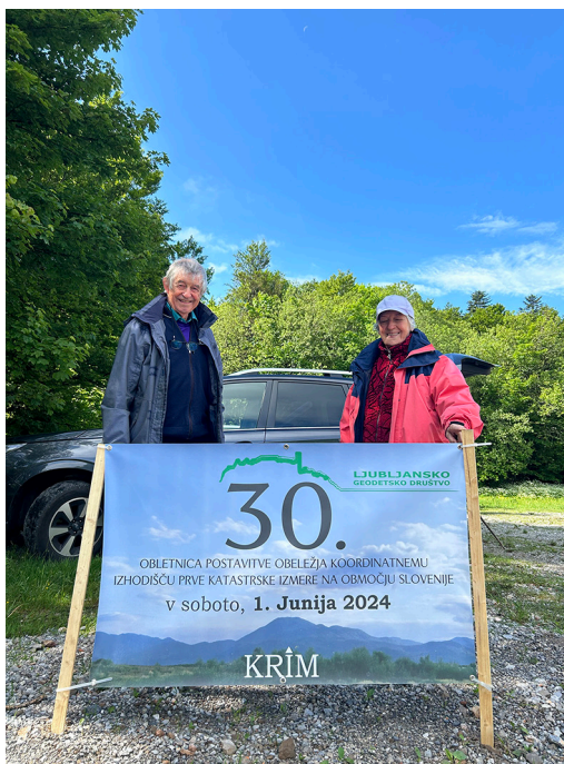
Slika 2: Sprejem udeležencev na Krimu.

Program je predvidel klasične dostopne poti, po katerih so udeleženci dostopali individualno, in sicer: