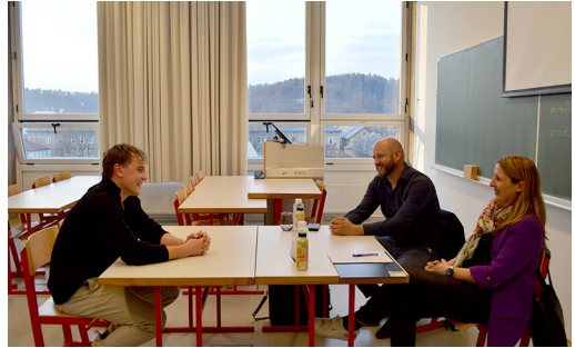
Slika 4: Hitri zmenki z Geodetsko upravo Republike Slovenije.