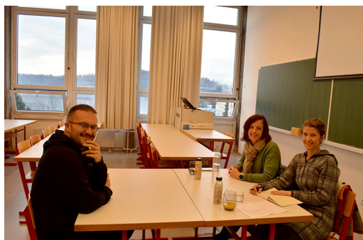
Slika 1: Hitri zmenki s podjetjem Dobrovita d.o.o.

Na naše povabilo se je odzvalo kar nekaj podjetij, in sicer, Dobrovita d. o. o., Flycom Technologies d.o.o., GD i d.o.o, LGB d.o.o. ter Geodetska uprava Republike Slovenije, ki so s svojimi predstavniki omogočili izvedbo in prispevali k pestrosti dogodka.