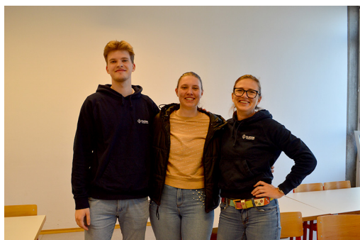
Slika 2: Hitri zmenki s podjetjem Flycom Technologies d.o.o.

Celoten potek hitrih zmenkov smo popestrili z odprtjem prenovljene pisarne DŠGS, ki je potekalo na strehi Fakultete za gradbeništvo in geodezijo. Med premorom in po hitrih zmenkih je bila organizirana manjša pogostitev, ki je dodatno okrepila vzdušje sproščene povezovanja in mreženja med udeleženci.