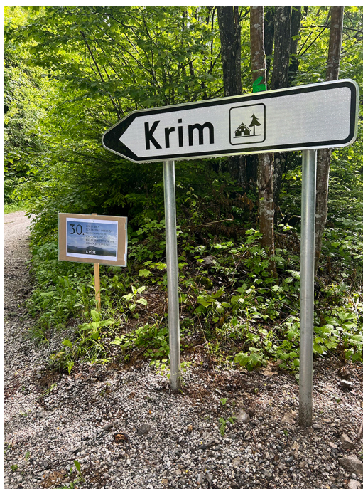
Slika 1: Prava smer je proti Krimu.

Skupina predanih geodetov Ljubljanskega geodetskega društva se je tradicionalno, prvo soboto v juniju, zbrala na srečanju na Krimu. Srečanje je slavilo 30. obletnico postavitve obeležja koordinatnega izhodišča prve katastrske izmere na območju Slovenije. Kljub deževnemu tednu se je ravno v soboto vreme izkazalo in pokazalo, da je junij sončen mesec.