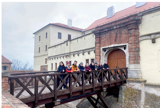
Slika 2: Ogled gradu Špilberk na vzpetini v središču Brna