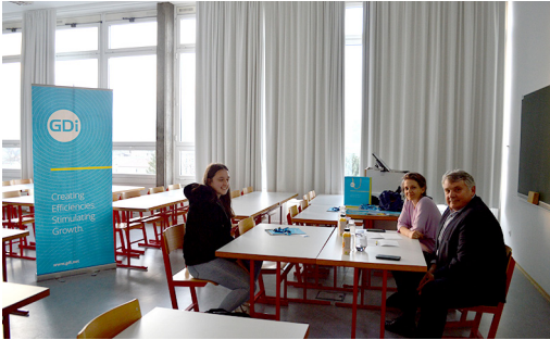
Slika 3: Hitri zmenki s podjetjem GDI d.o.o.

Vsem sodelujočim predstavnikom delodajalcev se iskreno zahvaljujemo za udeležbo na dogodku ter upamo, da se bodo iz hitrih zmenkov razvila prava razmerja!