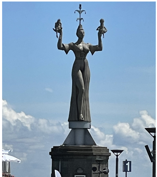
Sliki 4 in 5: Glede na versko tradicijo mesta precej drzen vrteči se kip Imperia, ki je znamenitost Konstance.