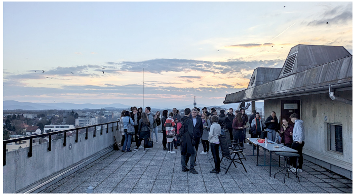
Slika 6: Otvoritev pisarne DŠGS na strehi FGG

Zapisala: Maja Filač