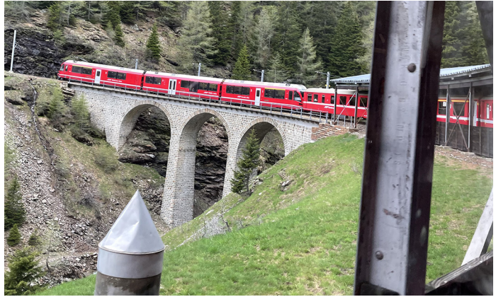
Sliki 2 in 3: Favorit drugega dne je bila vožnja z Bernina Ekspresom.

V soboto smo se že zgodaj odpeljali proti obali bližnjega Bodenskega jezera ter takoj prestopili še eno državno mejo, da smo lahko na jugozahodu Nemčije obiskali otok cvetja Mainau. Zaradi ugodnega podnebja ob jezeru lahko na otoku prosto rastejo tudi palme in druge sredozemske rastline. Grof Lennart Bernadotte je svoj otok rad imenoval kar Blumenschiff (Cvetlična ladja). Sprehod po urejenih vrtovih je bil tako res prava paša za oči. Seveda smo zvedavo pokukali tudi v tropski vrt ob gradu in na koncu še v hišo metuljev, ki so z živahnim obletavanjem močno zaposlili našo številčno fotografsko sekcijo.