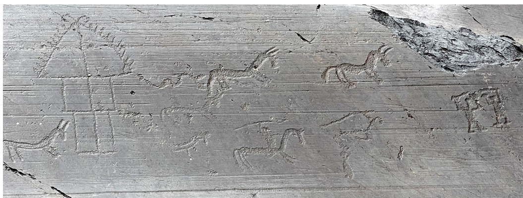
Slika 1: Prazgodovinski piktogram s podobami lova.

Sledila je vožnja po slikoviti pokrajini doline Camonica, znani po starih risbah, vrezanih na gladke skalne površine. Skalne poslikave v Val Camonici, ki prikazujejo dogodke iz vsakdanjega življenja staroselcev, so največja zbirka prazgodovinskih petroglifov na svetu. UNESCO je uradno priznal več kot 140.000 figur in simbolov, vendar se je z novimi odkritji število katalogiziranih vrezov povečalo na med 200.000 in 300.000. Petroglifi so razširjeni po vsej dolini, predvsem so koncentrirani na območjih Darfo Boario Terme, Capo di Ponte, Nadro, Cimbergo in Paspardo. Naš ogled risb nad krajem Capo di Ponte je sicer zmotil rahel dež in zmanjšal kontrastnost vklesanih podob na sivih, od ledenika zbrušeni površinah, zato smo morali precej naperjati vid, da smo dobili predstavo o videzu in obsegu upodobitev.