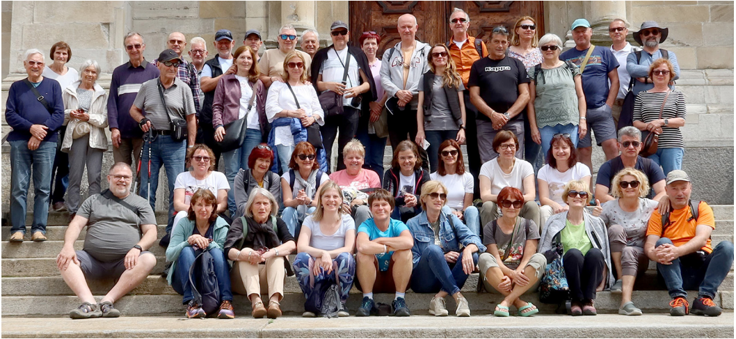
Slika 10: Skupinska fotografija udeležencev v Bellinzoni, pred slovesom od Švice.

Po daljši vožnji po razgibani pokrajini s čudovitimi vedutami smo noge pretegnili med ogledom Bellinzone, najbolj italijanskega mesta v Švici. Nad njim se dviguje sistem trdnjav, ki so varovale vstop v dolino. Osrednja trdnjava je prav tako uvrščena na Unescov seznam svetovne dediščine, saj je ena najpomembnejših primerov srednjeveškega obrambnega sistema v Alpah.