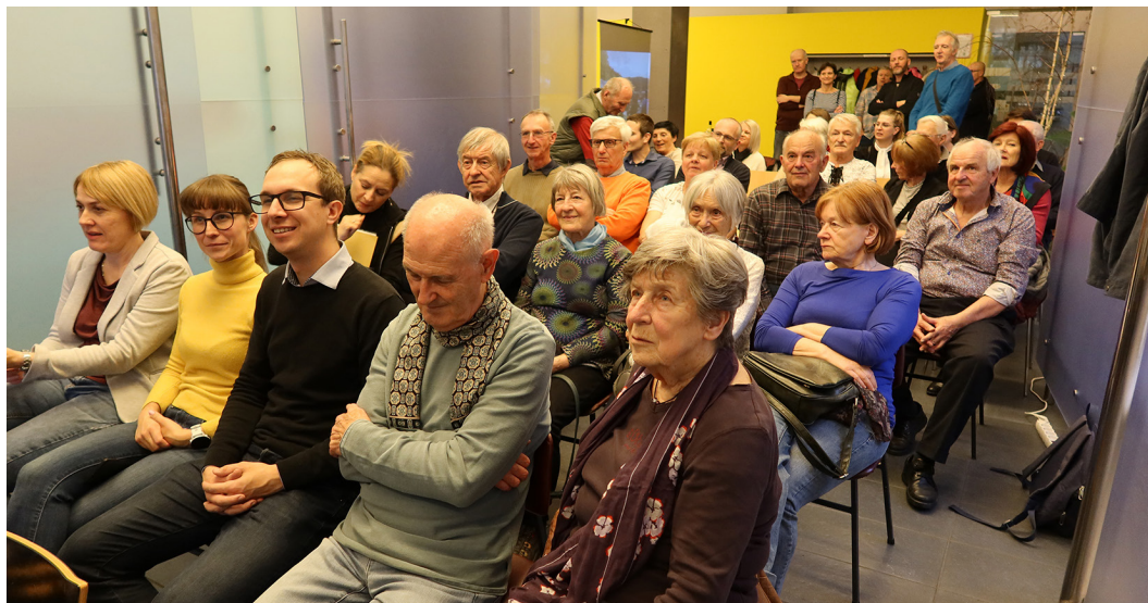
Slika 1: Prisotni člani so pozorno prisluhnili poročilom in z razpravo dopolnili dogajanje.

Po tej sproščeni polurni izmenjavi vtisov je občni zbor potekal skladno s predlaganim dnevnim redom. Predhodni, slikovno ponazorjeni pregled dela društva v letu 2023 smo formalno predstavili dotedanji predsednik društva, blagajničarka, predsednica nadzornega odbora in predsednik častnega razsodišča s poročili, ki jih je občni zbor soglasno sprejel brez pripomb.