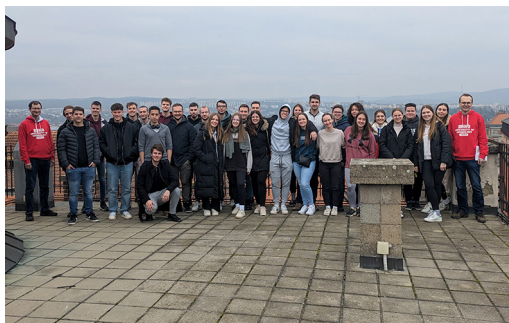
Slika 4: Ogled Tehniške univerze v Brnu