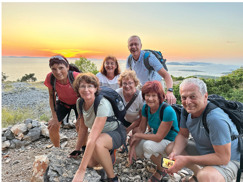
Slika 6: »Kornati z Raduča ob sončnem zahodu« – »kičasto« vabilo na naslednji, jubilejni 20. pohod.

Planinski izlet po vrhovih otokov nas je vodil na otok Murter . Tokratnega priljubljenega jesenskega pohoda po »Jadranski transverzali« se nas je udeležilo 49 članov, ki smo med 29. septembrom in 1. oktobrom v dobrem razpoloženju osvojili najvišji otoški vrh Raduč in si skladno s programom izleta ogledali še lepote naravnih parkov Una, Vransko jezero, Plitviška jezera in Rastoke pri Slunju. Večina nas je spotoma seveda preverila tudi slanost morja, prav vsi pa smo si okus popravili s pokušino rujne domače kapljice v dobri družbi (več v GV 4/2023).