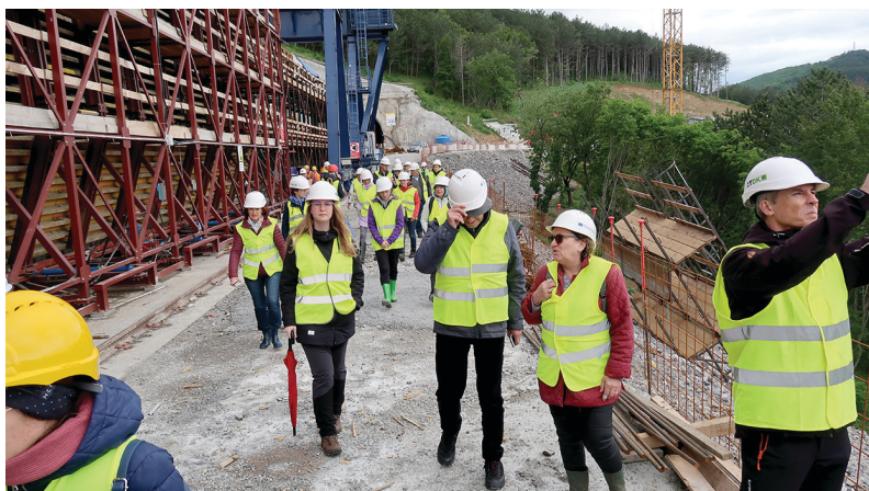
Slika 3: Udeleženci na gradbišču drugega tira proge Divača–Koper v dolini Glinščice.

Ekскурzija z ogledom gradnje 2. tira železniške proge Divača–Koper je bila izvedena 11. maja, na srečo na lep dan v sicer daljšem zelo deževnem obdobju. Udeležilo se je 31 članov, ogledu je sledilo družabno srečanje ob prigrizku. Udeleženci so ob izrazih zadovoljstva s tovrstnimi aktivnostmi predlagali še ekskurzijo, na kateri bi si ogledali gradnjo predora Karavanke, kar ostaja dolg za naslednje leto. Žal izvajalci del iz varnostnih razlogov običajno številčno močno omejijo tovrstne ogledе. IO zato priporoča članom prijavo v čakalno vrsto tudi po morebitni objavi zasedenosti vseh razpoložljivih mest, saj se pogosto zgodi, da kdo od prijavljenih udeležbo dopove.