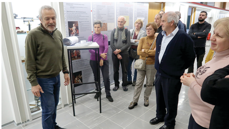
Slika 2: Udeleženci na hodniku oddelka za geodezijo v četrtem nadstropju stavbe na Jamovi cesti 2 v Ljubljani.

Občni zbor društva je bil izveden v četrtek, 9. marca, v restavraciji Marjetica (nasproti upravne enote Tobačna). V skladu s pravili društva smo začetek ob 17. uri zaradi nesklepčnosti zamaknili za pol ure. Čas smo si krajšali ob animiranem prikazu fotografij in ob njih obujali spomine na geodetske podvige v minulem letu. Zbora se je udeležilo 35 članov, ki so potrdili poročila za leto 2022, zasnovali načrt dejavnosti za leto 2023 in druženje nadaljevali ob večerji v istih prostorih.