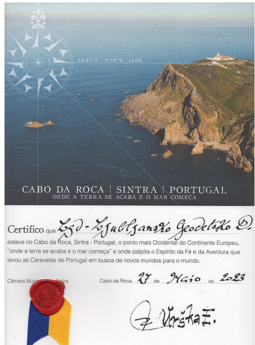
Slika 5: Potrdilo, da je Ljubljansko geodetsko društvo seglo vse do skrajne zahodne točke Evrope.