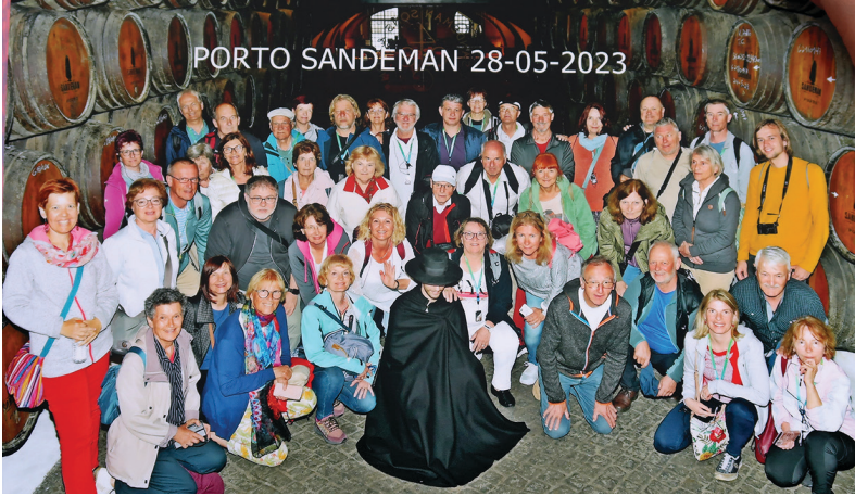
Slika 4: »Gasilska« med sodi v kleti Sandeman v Portu.

Geodetski izlet na Portugalsko je bil izveden med 25. in 28. majem v sodelovanju s sindikatom OGU Ljubljana. Izlet je v celoti uspel ob dobri volji 44 udeležencev, ki smo poleg Lizbone raziskali še druge znane kraje, kot so univerzitetno mesto Coimbra ali Nazaré z visokimi plimnimi valovi, umetniški Óbidos pa romarsko središče Fatima, se zapeljali do najbolj zahodne točke celinske Evrope na rt Cabo da Rocca in seveda tudi na pokušino znanega portovca v eno od večjih kleti v istoimenskem mestu Porto. Serija nepozabnih geodetskih izletov se nadaljuje.