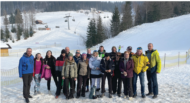
Slika 1: »Gasilska« pod smučiščem.

Smučarski izlet na smučišče Cerkno je bil, kot prva letna aktivnost, izveden 16. februarja. Izleta se je v lepem vremenu udeležilo 23 članov in pridruženih članov, od tega trije z lastnim prevozom. Po koncu smučanja smo klepetali ob lahki večerji in se zadovoljni vrnili domov v zgodnjih večernih urah. Udeleženci smo si, po preteklih »sušnih« letih, navdušeno obljubili ponovno snidenje ob letu osorej in si zastavili promocijske naloge, s katerimi bi privabili še koga od kolegov in povečali ekipo.