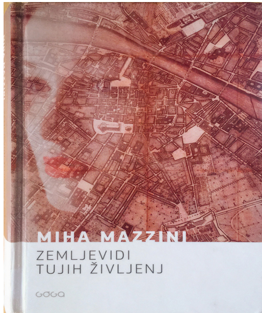
Slika 3: Zemljevidi tujih življenj (hrani: Knjižnica Mirana Jarca Novo mesto, foto: Boštjan Pucelj).

ob pregorelosti ali živčnem zlomu. V zgodbo so vpleteni resnični pripetljaji, a jih protagonist zaključí z besedami, ki jih novinarji ne smejo ali zmorejo (umor geometra pri Velikih Laščah): »Še preden so mediji napolnili obsežnejša poročila, je Robert že slutil profil morilca: starejši, živi sam z materjo, ki z jezikom trga meso z njegovih kosti. Če bi bila to žena, bi jo tepel, matere pa ne sme in se zato nazadnje sprosti z nečim, kar ga pripelje v varno izolacijo zapora.« Bralec v romanu ne izve veliko o inženirjih, njihovem delu ali strokovnem poslanstvu, saj je bistvo zgodbe povsem drugače. Sreča ali podoživi pa tiste drobtinice, ki inženirje postavi v navidezen svet čudakov z razlogom, oziroma bi lahko rekli, da jim je življenje prisvojila poklicna deformacija. »Obraz je izrisal s topografskimi znaki, obale po robovih lic, s plastnicami in senčnim reliefom je prikazal nos, preko oči je včasih narisal jezere, spet drugič gore ali gozdove in nazadnje ustvaril zemljevid povsem izmišljene dežele, na dnu katere je tičalo nekaj znanega, vsaj zanj, saj svojega dela nikomur ni kazal.« Roman je bil uvrščen med finaliste za nagrado Kresnik leta 2017.