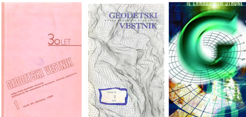
Slika 4: Preprosta naslovnica iz 80. let (levo), cel svet v geodetsko mrežo ujet je bil slogan Geodetskega vestnika v 90. letih (sredina), mreženje v geodeziji je bil slogan naslovnice tudi na prehodu v novo tisočletje (desno).

Vzporedno z vse odmevnejšimi raziskovalnimi in inovativnimi deli geodetske stroke v Sloveniji se je stopnjeval interes za kakovostne znanstvene in strokovne objave v Geodetskem vestniku. Že leta 1988 je bila uvedena tematska klasifikacija znanstvenih in strokovnih člankov UDK, ki je knjižnični klasifikacijski sistem in mednarodno enotno normativno orodje za vsebinsko označevanje dokumentov. Od leta 1991 je iz objav jasno razvidno, da so bili znanstveni in strokovni članki recenzirani, počasi se je začela uvajati struktura objave recenziranih člankov po sistemu IMRAD (uvod, metode, rezultati in razprava, sklep), objave nekaterih recenziranih člankov so že bile tudi v angleškem jeziku. V letu 1997 je bil prvič imenovan mednarodni uredniški odbor s priznanimi mednarodnimi strokovnjaki. Geodetski vestnik je tako že v 90. letih preteklega stoletja postal pomembna strokovna revija, ki je začela pot v mednarodne vode, glavnino prispevkov so počasi zavzele znanstvene in strokovne objave.