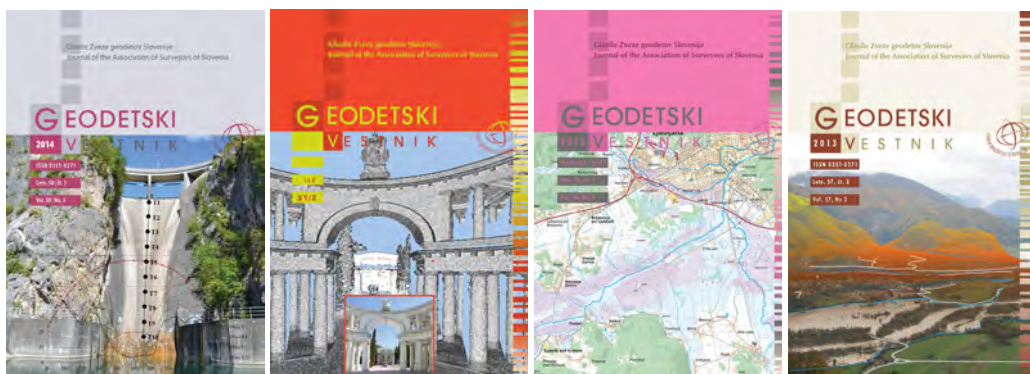
Slika 5: Naslovnice Geodetskih vestnikov odražajo bogato vsebino objav v reviji – od klasične inženirske geodezije, geoinformatike do prostorskega načrtovanja.

V šestih desetletjih je Geodetski vestnik iz društvenega glasila prerasel v ugledno mednarodno revijo, v kateri se danes srečujejo interdisciplinarne teme, vezane na merske tehnologije za opazovanje Zemlje in inženirske dejavnosti, geografske informacijske sisteme in prostor, kjer se stikajo pogledi domačih in tujih strokovnjakov različnih strok. Poleg recenziranih znanstvenih in strokovnih člankov v slovenskem in/ali angleškem jeziku, ki sestavljajo glavnino vsebine, so objavljene novice državne geodetske službe ter poljudni prispevki, društvene novice in podobni zapisi. Kljub mednarodni prepoznavnosti, ki je ključnega pomena za razvoj stroke, strokovno odličnost in mednarodno konkurenčnost, ostaja s svojimi objavami zvest tudi slovenskemu jeziku in slovenski stroki, in sicer zaradi prepričanja ustvarjalcev revije, da sta negovanje slovenskega jezika in razvoj strokovne terminologije izrednega pomena za razvoj stroke v nekem jezikovnem okolju.