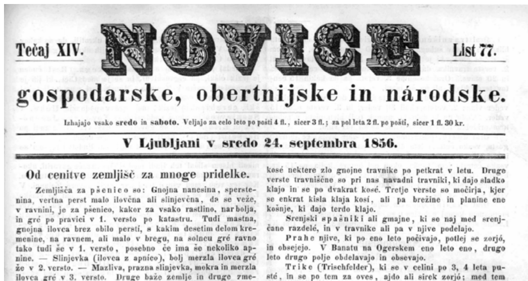
Slika 1: V Kmetijskih in rokodelskih novicah so pogosto pisali o zemljiškem davku in zemljiškem katastru (Novice, 1856).

Geodetski vestnik, znanstvena revija in strokovno glasilo Zveze geodetov Slovenije, letos zaznamuje šestdeseti letnik izhajanja. Pregled prispevkov, ki so bili objavljeni v reviji, podaja zanimivo sliko o razvoju geodezije v Sloveniji, nekdanji Jugoslaviji pa tudi na mednarodni ravni. Obravnavamo ga lahko kot kronologijo povojnega razvoja geodezije na domačih tleh in mednarodno. Zapisana besedila so zagotovo izredno prispevala k razvoju strokovne terminologije v slovenskem jeziku, saj so bile v Geodetskem vestniku redno objavljene tehnološke in druge novosti na širšem področju geodezije.