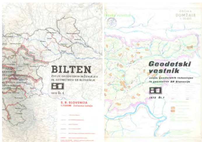
Slika 3: Pomen prostorskih podatkovnih podlag pri prostorskem načrtovanju in izzivi sodobne kartografije so pomembno zaznamovali geodezijo v 70. letih preteklega stoletja: naslovnici Biltena iz 1970. (levo) in prve številke Geodetskega vestnika iz 1973. (desno).

Veliko prelomnico prinese leto 1973, ko se je revija preimenovala v Geodetski vestnik , v istem letu je tudi Društvo geodetskih inženirjev in geometrov Slovenije pridobilo ime Zveza geodetov Slovenije . Že Bilten je prerasel okvirje glasila zveze, novo ime strokovne geodetske revije pa je napovedovalo še več kakovostnih objav z vse širšega področja geodezije. Tehnološki razvoj in širjenje področja delovanja geodetske službe in geodezije sta zahtevala, da se geodeti sproti seznanjajo z novo tehnologijo, novimi izzivi, novo zakonodajo in standardi.