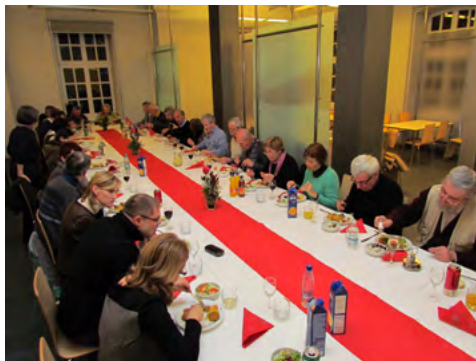
Slika 9: Na občnem zboru Ljubljanskega geodetskega društva je bilo kot na »ohceti«.