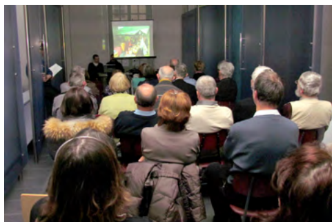
Slika 1: Fotoreportaža društvenih aktivnosti v letu 2012