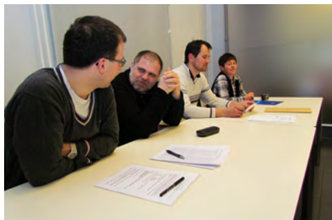
Slika 3: Delovno predsedstvo in organi občnega zbora društva. Profesionalno!