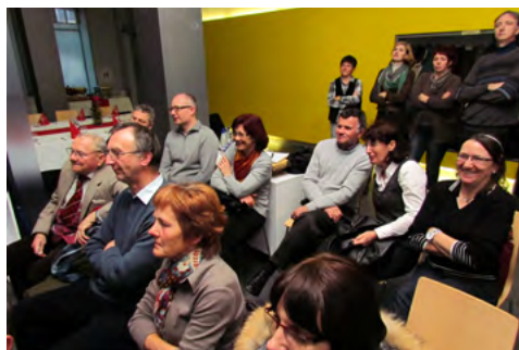
Slika 2: Odzivi občinstva zaradi necenzuriranih fotografij ...