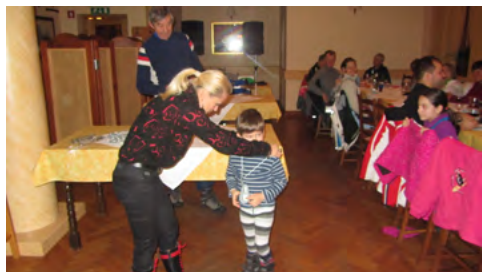
Slika 5: Priprave najmlajših so se obrestovale