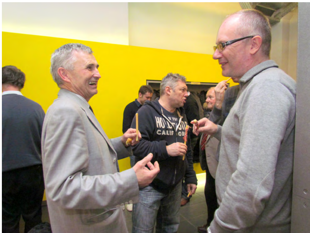
Slika 7: Pogovor dveh članov o programu društvenih aktivnosti pove vse – da je pač odličen!