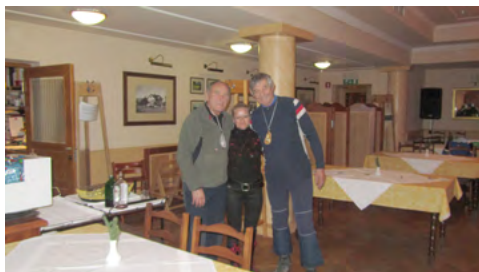
Slika 6: ... starejših pa seveda tudi. Vse čestitke.