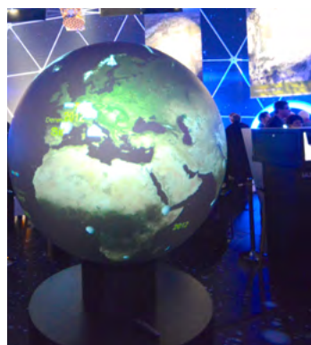
Notranjost velikega šotora, ki ima predvsem izobraževalni pomen

Naše dobro sodelovanje z Evropsko komisijo in agencijo GNSS, ki izvaja projekt Space Expo, nam omogoča, da tudi mi v projektu aktivno sodelujemo in predstavljamo našo stroko širši javnosti, predvsem pa mlajšim populacijam, ki ta premični paviljon obiščejo v največjem številu. Space Expo je ta trenutek na ogledu v Londonu.