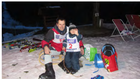
Slika 3: Priprave mlajših in starejših tekmovalcev