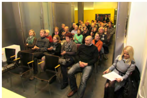
Slika 4: Aplavz ob predstavitvi finančnega poročila