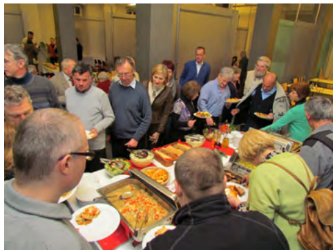
Slika 8: Udeleženci občnega zbora Ljubljanskega geodetskega društva so si zaslužili okrepčilo.