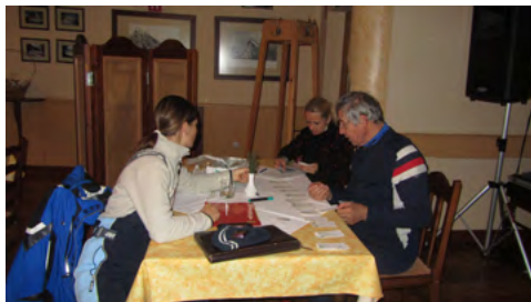
Slika 4: Še malo, pa bodo znani rezultati.