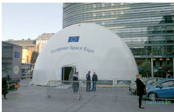
Premična inštalacija Space Expo, ki obiskuje evropske prestolnice

22. marca 2013 bomo praznovali drugi Evropski dan geodetov. Osrednje praznovanje je predvideno v Budimpešti. Evropska komisija je podprla naša prizadevanja in bo v istem terminu organizirala oz. predstavila v madžarski prestolnici European Space Expo (projekt, ki je namenjen predstavitvi vesoljskih tehnologij in njihovega vpliva na boljše življenje prebivalcev Evrope). Take in tej podobne pobude nam ponujajo možnost, da dvigujemo ozaveščenost ljudi o naši stroki. Praznovanje pa ne bo potekalo samo v Budimpešti. Tako kot v letu 2012, ko smo obeležili prvi Evropski dan geodetov, bodo tudi v letu 2013, v tednu od 16. do 24. marca, praznovali v mnogih evropskih državah. Na zadnji generalni skupščini CLGE smo se odločili, da v letu 2013 počastimo spomin na Galilea Galilea. Upam, da bo čim več organizacij, vključno s slovensko IZS, v ta namen organiziralo prireditve in na aktiven način počastilo Evropski dan geodetov.