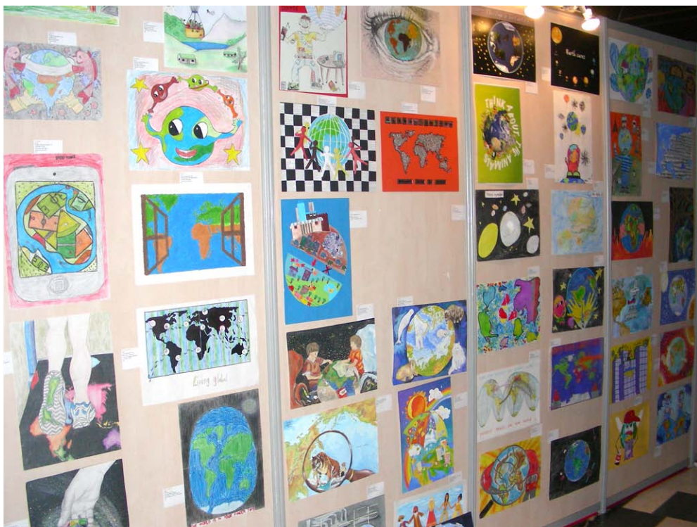
Slika 1: Slovenske slike otrok s kartografsko tematiko prvič na razstavah mednarodnih kartografskih konferenc

Letošnja konferenca Mednarodnega kartografskega združenja (ICA/ACI, International Cartographic Association/Association Cartographique Internationale), 25. po vrsti, je potekala od 3. do 8. julija 2011 v Parizu, kjer je bila pred pol stoletja, torej leta 1961, organizirana tudi prva konferenca. Letošnjega dogodka se je udeležilo približno 1400 kartografov in drugih strokovnjakov, ki se posredno ukvarjajo s kartografijo in sorodnimi geoinformacijskimi znanostmi. Glavni organizator je bil Institut géographique national (IGN), osrednja ustanova v Franciji za zajem, vodenje in vzpostavljanje topografskih podatkov ter za tisk in distribucijo državnih in tematskih kart. Konferenca je bila organizirana v kar prevelikem kongresnem centru Palais des Congrès blizu slavoloka zmage. Iz Slovenije smo se je udeležili štirje predstavniki, in sicer