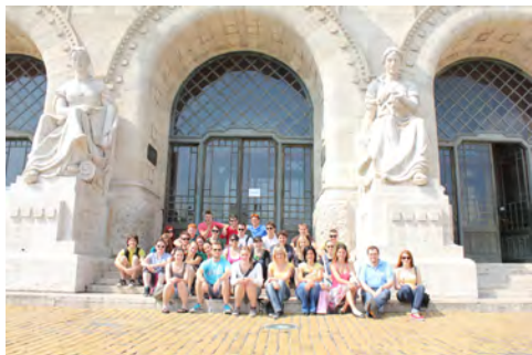
Slika 3: Pred Tehnično univerzo v Budimpešti