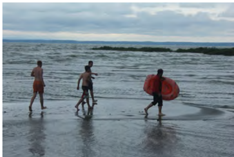
Slika 6: Blatno jezero