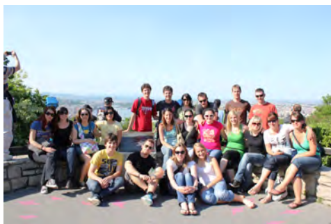
Slika 2: Poziranje na Citadeli