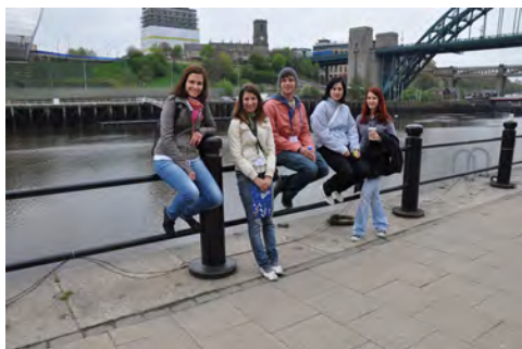
Slika 3: Na potepu po mestu