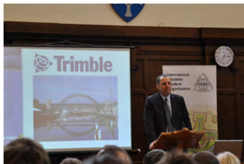
Slika 6: Predstavniki podjetja Trimble