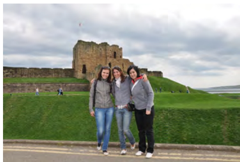
Slika 4: Na severni obali

Takšni dogodki so odlična priložnost za študente geodezije, da se lahko v slabem tednu dni seznanimo z aktualnimi dogajanjem v stroki, poslušamo predavanja priznanih strokovnjakov, si izmenjamo znanja in izkušnje na strokovnem področju ter navsezadnje spoznamo kulturo, zgodovino in znamenitosti gostujoče države.