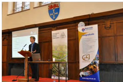
Slika 1: Glavni organizator na slovesnem odprtju

Eden izmed najbolj zanimivih večerov je bil tako kot vsako leto nacionalni večer, kjer vsaka država predstavi svoje kulinarične dobrate. Pri slovenski mizi so udeleženci lahko poskusili domačo orehovo potico, kruh in salamo, vse to pa »poplanknili« s kozarčkom borovničevega likerja in medicine.