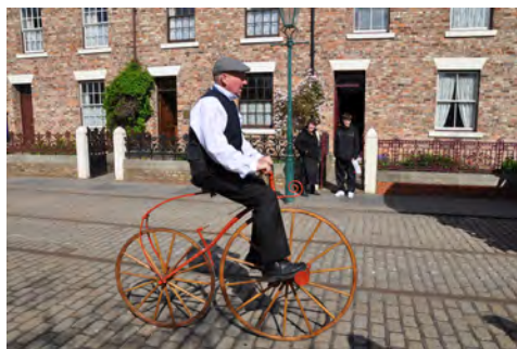
Slika 2: Muzej Beamish