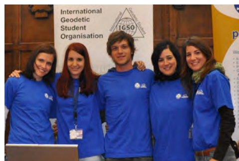
Slika 8: Slovenski predstavniki