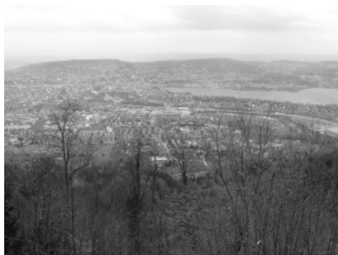
Slika 6: Pogled na Zürich z Uetliberga