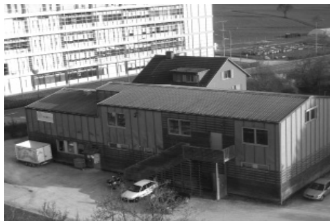
Slika 2: Stavba, v kateri smo bivali.

Organizatorji so udeležencem pripravili pester program in nas kaj hitro navadili na »švicarsko točnost«. Doživeli smo kar precej zanimivih predstavitev, pet delavnic in obisk vsem dobro znanega podjetja Leica Geosystems. S turističnim vlakcem smo se želeli odpeljati tudi do Bodenskega jezera, a smo na pol poti doživeli presenečenje – vlakec se je iztiril, zato smo preostanek poti kar prehodili.