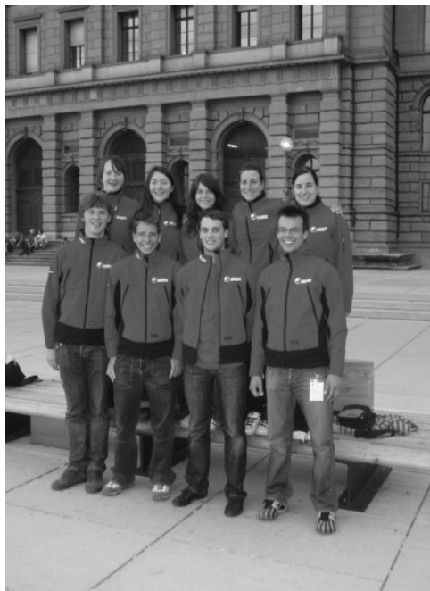
Slika 3: Slovenski predstavniki na IGSM-u