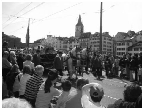
Slika 7: Karneval v središču mesta

Študentje pa ne bi bili študentje, če se ne bi vsak večer udeležili tudi »geofešt«. Začelo se je že prvi dan s piknikom na strehi ene izmed stavb ETH Hönggerberg in se naslednji večer nadaljevalo z »IGSM Partyjem« v dvorani univerze. Ker organizatorji letos niso pripravili nacionalnega večera, je naš harmonikar popestril tretji večer, mi pa smo prisotnim ponujali domačo orehovo potico. Zadnji večer so organizatorji pripravili slavnostno večerjo, na kateri smo jedli njihovo tradicionalno hrano in se ob zvokih žive glasbe še zadnjič skupaj naplesali.