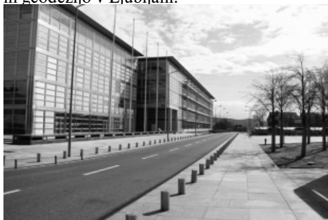
Slika 1: HCl, ena izmed stavb ETH Hönggerberg, kjer se je vse dogajalo.

Tudi letos se je pod okriljem IGSO (International Geodetic Student Organization) zgodil IGSM (International Geodetic Student Meeting). Tokratno, že dvaindvajseto srečanje zapovrstjo je potekalo od 14. do 19. aprila 2009 v Zürichu v Švici. Takšni dogodki so odlična priložnost za študente geodezije, da se lahko v slabem tednu dni seznanimo z aktualnimi dogajanjem v stroki, poslušamo predavanja priznanih strokovnjakov, si obogatimo in izmenjamo izkušnje na strokovnem področju, utrjujemo mednarodna poznanstva in ne nazadnje spoznamo kulturo, zgodovino ter znamenitosti gostujoče države in mesta. Gostitelj letošnjega IGSM-a je bila švicarska tehnična univerza v Zürichu (ETH Zürich), ki je sprejela nekaj več kot sto petdeset študentov iz vse Evrope, med njimi tudi devet študentov geodezije s Fakultete za gradbeništvo in geodezijo v Ljubljani.