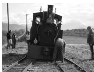
Slika 5: »Presenečenje« ob Bodenskem jezeru