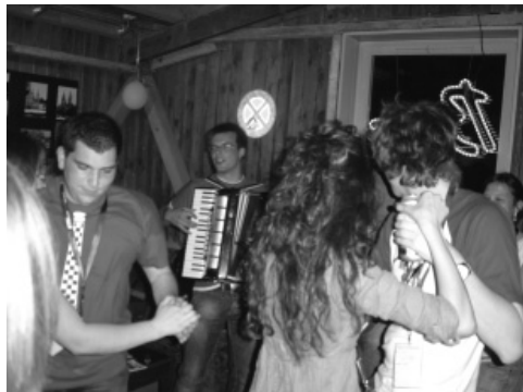
Slika 8: Ples ob zvokih Tilnove harmonike