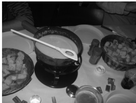
Slika 9: Švicarska tradicionalna jed

Domov smo se vrnili z lepimi spomini na Švico, polni novih idej, izkušenj in poznanstev. Organizatorji so svojo vlogo odlično opravili in prepričan sem, da so si naslednji teden privoščili zasluženi počitek in sprostitev. Nas pa že za prihodnje leto vabijo sosedje na desnem bregu Kolpe in levem bregu Sotle, ki se bodo po najboljših močeh potrudili biti vsaj tako točni, kot so bili Švicarji tisti teden v aprilu. Ali jim bo uspelo, bomo videli maja prihodnje leto.