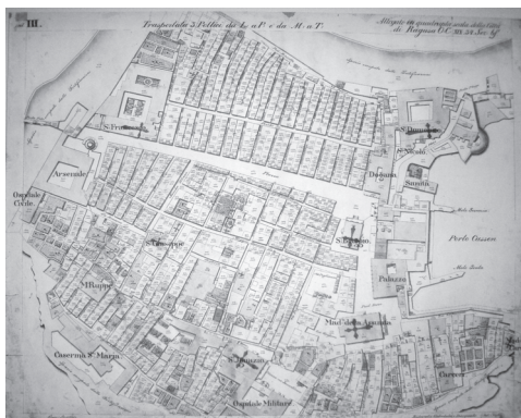
Slika 2: Katastrski načrt Dubrovnik iz leta 1837.