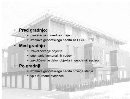
Slika 1: Geodetske storitve v fazah gradnje.

Občinski upravni organ, pristojen za urejanje prostora, je na zahtevo dolžan izdati lokacijsko informacijo z namenom gradnje objekta. Lokacijska informacija je obvezna sestavina vsakega projekta za pridobitev gradbenega dovoljenja. Namen lokacijske informacije je predvsem pridobitev podatkov o namenski rabi prostora, podani so lokacijski in drugi pogoji, kot jih določajo občinski prostorski izvedbeni akti ter podatki o prostorskih ukrepih (Rakar, 2005).