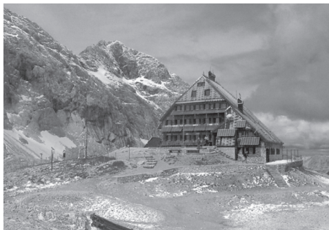
Slika 3: Veliki Triglav (2864 m) in Planinski dom na Kredarici (2515 m).

(2042 m, nad Krnskim jezerom) 78 B 3, Mangart (2679 m, pod katerega pripelje do Mangartskega sedla najvišja cesta v Sloveniji – 2072 m) 52 A 2, Muzec (1630 m, na povsem zahodnem delu Slovenije) 76 A 3, Ozebnik (2480 m, sosed Jalovca, ki je po anketi v Planinskem vestniku naša najlepša gora) 52 B 2, Pelc (2388 m, nad Zadnjo Trento) 52 B 3, Pihavec (2090 m) 52 A 3, Polovnik (1471 m, z bogato zgodovino iz prve svetovne vojne) 77 A 2, Pršivec (2056 m, pod Rjavino) 54 A 3, Razbor (1290 m, na širšem področju Snežnika) 199 A 3, Rog (1099 m, najvišji vrh Kočevskega Roga) 188 A 2, Rogatec (1557 m, »ležeči menih« nad Gornjim Gradom) 86 C 2, Snežnik (1796 m, pogosto s snežno kapo) 199 B 1, Travnik (1637 m, na gorskem grebenu med Štajersko in Koroško) 61 B 2, Turn (1183 m, nad Trzičem) 83 C 1, Zvoh (1971 m, v sklopu smučarskega središča Krvavec) 85 B 2.