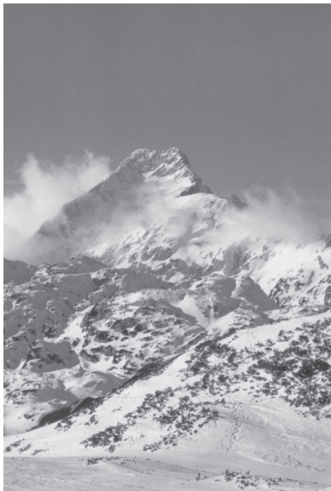
Slika 1: Velika Ojstrica (2350 m) v snegu, po anketi v Planinskem vestniku naša druga najlepša gora.