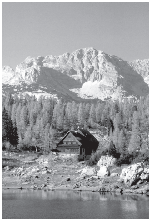
Slika 5: Veliko Špièje (2398 m) nad Koèò pri Triglavskih jezerih (1685 m).

najzahodnejši dvatisočak Košute (2088 m) 57 B 2,