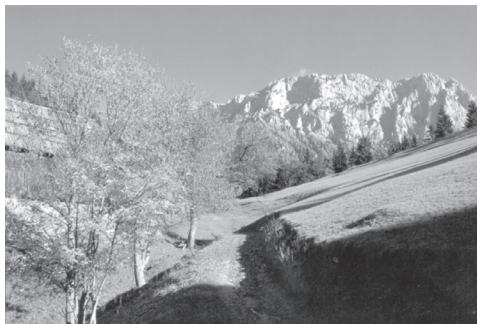
Slika 2: Velika Raduha (2026 m).