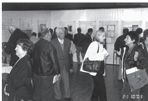
Slika 1: Živahen utrip na otvoritvi razstave.

Razstava je bila pripravljena z namenom, da se osvetli zemljemerstvo kot pomembna panoga, s katero pride v stik vsaj občasno vsak občan. Dokumenti in podatki s tega področja v veliki meri pričajo o življenju ljudi v kraju. Pa tudi območje Idrijskega in Cerkljanskega je za slovensko geodezijo pomembno območje, saj je pomembno prispevalo k razvoju slovenske geodezije s svojim bogatim jamomerskim, zemljemerskim in kartografskim izročilom, povezanim z Rudnikom živega srebra Idrija.