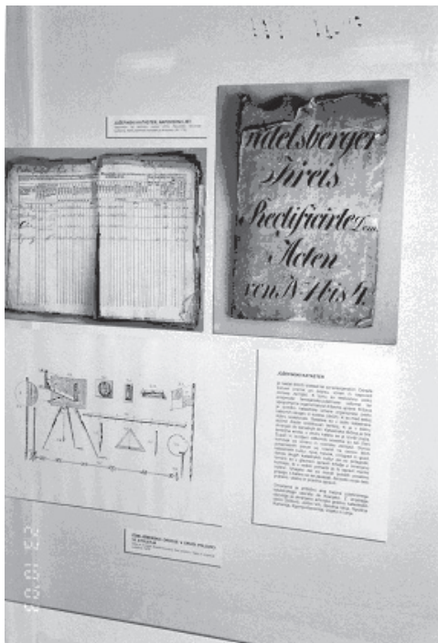
Slika 2: Prikaz jožefinskega katastra.

Janez Pirc je v prvem delu publikacije opisal nastanek in razvoj katastrov na našem ozemlju. Podrobno opisuje urbarje, imensko knjigo ter predhodnike sodobnega katastra na slovenskem – terezijanski, jožefinski in franciscejski kataster z navedbami o tem, kje se hrani njihov arhiv. Na razstavi je bil najdragocenejši dokument v tem sklopu Urbar idrijskega gospostva iz leta 1680, častitljiva knjiga, ki jo hrani Mestni muzej iz Idrije. Na razstavi je bilo še več drugih zanimivih listin in kart, med njimi karta idrijskega gospostva iz leta 1814 in cerkljanske župnije iz druge polovice 18. stoletja.