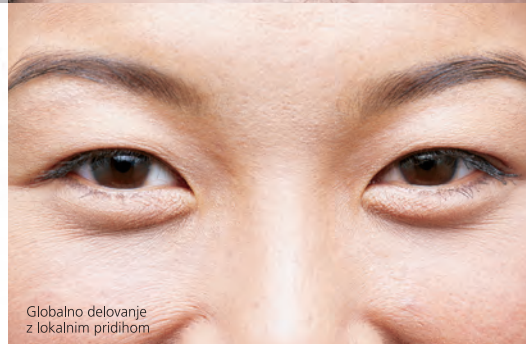
Globalno delovanje z lokalnim pridihom