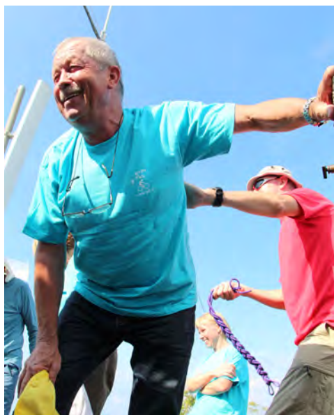
Slika 6 – Krst na vrhu