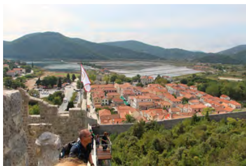
Slika 1 – Na obzidju Ston

Mejo z BiH smo prečkali brez težav, se za kratko ustavili v Neumu, še enkrat prečkali mejo in nadaljevali pot mimo mnogih školjčič v zalivu med celino in Pelješcem. Trajekt nam je zbežal, pa smo si privoščili ogled starega mesteca Stona, sprehod po veličastnem obzidju, ogled solin in pokušnjo školjk.