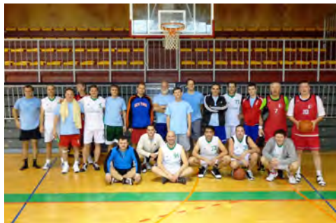
Slika 1: Skupinska fotografija