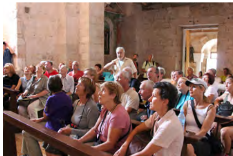
Slika 4 – V cerkvi iz 12. stoletja, predelani v času romanike, smo izvedeli veliko o umetnostnih slogih, simbolih, verah, grščini, zgodovini in benediktincih, ki so prvi naselili otoček.

Morsko pot med Praprotnim na Pelješcu in Sobro na Mljetu smo prepluli v dobre pol ure. Izkrkali smo se na osmem največjem hrvaškem otoku, oziroma največjem v dubrovniškem arhipelagu. Dolg je le 37 kilometrov, širok pa največ tri. Kljub majhnosti otoka smo se do Pomene ali OPomene, kot kraj radi imenujejo domačini, vozili debelo uro. Cesta je precej ozka, z mnogimi vzponi in spusti, z nešteto ovinki in najrazličnejšimi ovirami, mimo katerih se je avtobus prebijal le z veliko spretnostjo voznika. Omejitve hitrosti na 20 km/h niso bile redke, najbolj adrenalinska pa je bila cesta skozi Polače. Skozi stolp nekdanje trdnjave je speljana asfaltirana cesta, vrata pa so le nekaj centimetrov širša od avtobusa. Sicer pa leži kraj v lepem zalivu in ob turkizno zelenem morju. Menda je to eden najvarnejših zalivov za plovila v Jadranu. Ko se je cesta končala, smo se ustavili pred hotelom Odisej, edinim na tem otoku. Sončno popoldne smo izkoristili za kopanje v precej toplem in zapeljivo čistem morju.