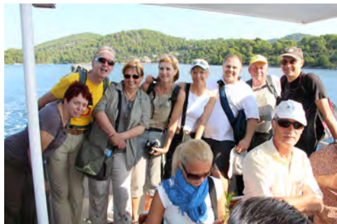
Slika 3 – Ladjica nas je popeljala na otoček Sv. Marije, na katerem stoji benediktinski samostan.