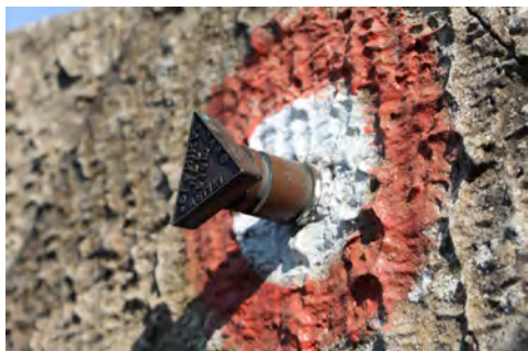
Slika 7 – Žig na Velikem gradu (514 m)

Domačini verjamejo, da je tukaj sedem let prebival Odisej pri nimfi Kalipso, dokler ni posredoval veliki Zevs in mu omogočil nadaljevanje poti proti rojstni Itaki. Najpogumnejši so skočili v morje in zaplavali v votlino. Nimfe v njej ni bilo, očarala pa jih je lepa turkizna barva vode, ki je posledica loma sončnih žarkov. Iz vode so se morali povzpeli z vrvo. Vrnitev k avtobusu je vzponu dodala še tiste metre, ki so nam bili prihranjeni ob startu s ceste proti vrhu.