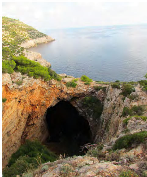
Slika 5 – Pogled na Odisejevo špiljo

Morsko pot med Praprotnim na Pelješcu in Sobro na Mljetu smo prepluli v dobre pol ure. Izkrkali smo se na osmem največjem hrvaškem otoku, oziroma največjem v dubrovniškem arhipelagu. Dolg je le 37 kilometrov, širok pa največ tri. Kljub majhnosti otoka smo se do Pomene ali OPomene, kot kraj radi imenujejo domačini, vozili debelo uro. Cesta je precej ozka, z mnogimi vzponi in spusti, z nešteto ovinki in najrazličnejšimi ovirami, mimo katerih se je avtobus prebijal le z veliko spretnostjo voznika. Omejitve hitrosti na 20 km/h niso bile redke, najbolj adrenalinska pa je bila cesta skozi Polače. Skozi stolp nekdanje trdnjave je speljana asfaltirana cesta, vrata pa so le nekaj centimetrov širša od avtobusa. Sicer pa leži kraj v lepem zalivu in ob turkizno zelenem morju. Menda je to eden najvarnejših zalivov za plovila v Jadranu. Ko se je cesta končala, smo se ustavili pred hotelom Odisej, edinim na tem otoku. Sončno popoldne smo izkoristili za kopanje v precej toplem in zapeljivo čistem morju.