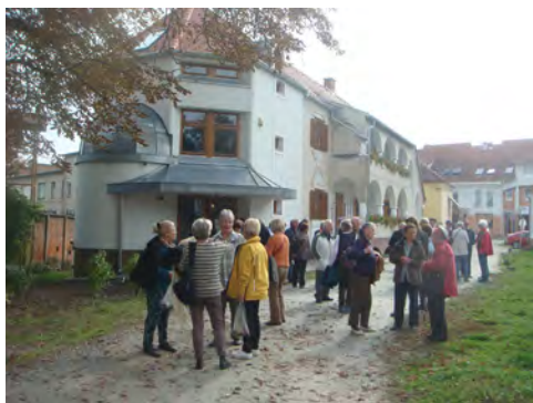
Slika 2: Udeleženci izleta pred etnološkim muzejem