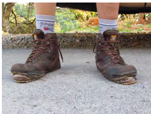
Slika 9 – Kljub ne preveč hudem vzponu nekaterim čevlji niso zdržali.

Ljubljana nas je v zadnjih nedeljskih urah sprejela neprijazno, z dežjem in mrazom.