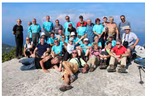
Slika 8 – Skupinska slika na najvišji točki Mljeta