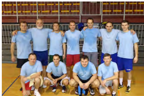
Slika 2: Zmagovalna ekipa