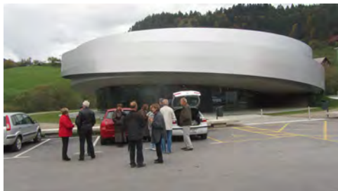
Slika 1: Zbirno mesto pred Kulturnim središčem vesoljskih tehnologij

Zadnjih 25 let se sošolke in sošolci Ge 4a, letnik 1959, sestajamo vsako leto dvakrat. Prvič se zberemo samo sošolke in sošolci ter se tudi dogovorimo, kam po Sloveniji nas bo peljala dobra volja, seveda v družbi z možmi in ženami ter prijatelji. Tako smo se letos na izletu družili in spoznavali Slovenijo že sedemnajstič. Tokrat smo obiskali Vitanje in Zreče pod Pohorjem.