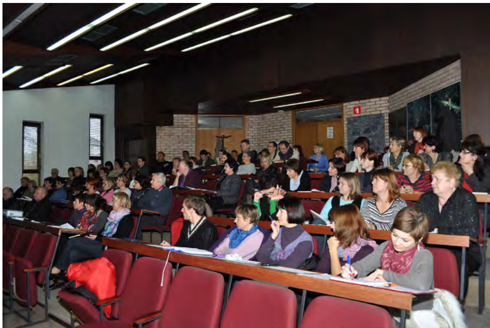
Slika 2: Udeleženci z zanimanjem spremljajo predavanje.

Strokovno srečanje smo zaradi velikega zanimanja povabljenih izpeljali dvakrat, 14. 11. in 19. 11., ter na dveh lokacijah. Prvič na naši standardni lokaciji v občinski dvorani v Šentjurju, drugič pa v sejni dvorani MO Velenje. Obema županoma se iskreno zahvaljujemo, da sta nam omogočila brezplačen najem prostorov. Dvorani smo dodobra napolnili, tako je skupno število poslušalcev preseгло število 130 in tudi naša pričakovanja. Gradivo s predavanj je na voljo na naši spletni strani cgd.si , najdete ga v zavihku CGD obvestila.