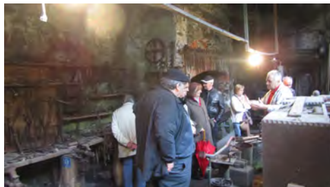
Slika 2: Udeleženci izleta v kovaškem tehničnem muzeju

V Vitanju smo si ogledali Kulturno središče evropskih vesoljskih tehnologij, ki je posvečeno slovcu Hermanu Potočniku Nordungu. Bil je prvi na svetu, ki je teoretično prikazal pot v vesolje, njegovo teorijo je v praksi uporabila tudi NASA. Njemu v čast je postavljena stalna razstava 100 monumentalnih vplivov. Število sto pomeni sto slik ali skic iz njegove knjige. Nordung si je postavil spomenik s knjigo Problemi vožnje po vesolju, v kateri je opisal načrt za prodor v vesolje in bivanje v njem. Druga razstava se imenuje Slovenski vrhovi (pri osvajanju vesolja, op. av.).