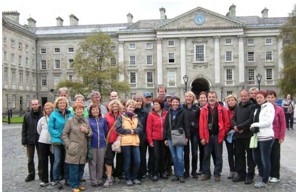
Slika: Kljub mrazu dobro razpoloženi udeleženci izleta – v ozadju Trinity College

Vtisi s prijetnega izleta in druženja bodo ostali ter nas opominjali, da se mora človek včasih »odklopiti«, da lahko nadaljuje z vsakdanom.