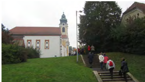
Slika 1: Pogled na srednjeveško cerkev v Monoštru

znamenitosti Gornjega Senika smo nadaljevali vožnjo skozi slovenske vasi do Monoštra, med katero nas je vodička seznanila z delovanjem slovenske skupnosti v Porabju, kjer so Slovenci pred 80 leti predstavljali 70 odstotkov, danes komaj 10 odstotkov prebivalstva. Spodbudne so bile njene napovedi, da se odnos madžarske države do Slovencev izboljšuje.