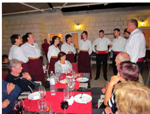
Slika 10 – Zaključna večerja ob dalmatinski klapi

Vesna Mikek slike 1 do 7 Miha Muck slike 8 do 10 Igor Cergolj