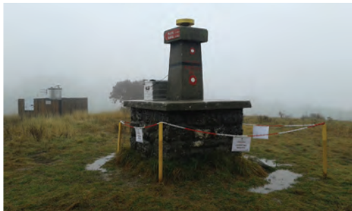
Slika 8: Točka Korada, v ozadju točka mreže 0. reda.

neugodni mikrolokaciji (na primer Bukovec, stabilizirana na poševnem terenu sredi njive, ki se obdeluje). Pri teh bo treba končne rezultate interpretirati zelo pazljivo.