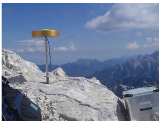
Slika 5: Pogled z Mangarta.