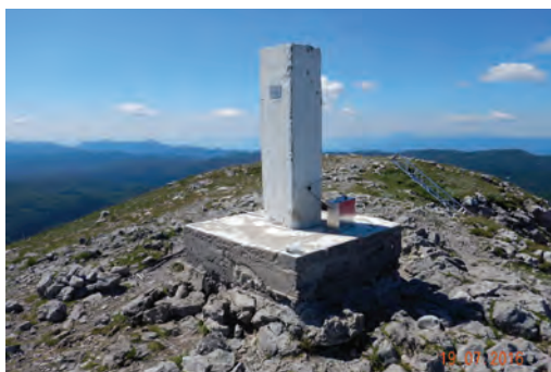
Slika 2: Trigonometrična točka I. reda 175 (Snežnik) pred sanacijo in po njej.

Pred izmero je bila pregledana oprema za merjenje, nabavljeni so bili manjkajoči kosi, treba je bilo tudi oblikovati obrazec zapisnika ter pripraviti navodila za ravnanje z instrumentom, izpolnjevanje zapisnika in arhiviranje podatkov. Instrumenti so bili pred začetkom projekta ustrezno testirani. Izvedeno je bilo tudi izobraževanje vseh operaterjev, ki so sodelovali v kampanji.