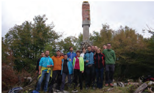
Slika 9: Obisk Dolenjskega geodetskega društva na točki Debeli vrh.