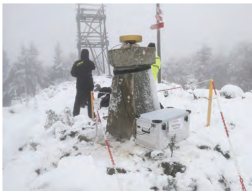
Slika 6: Zimske razmere na točki Vivodnik.