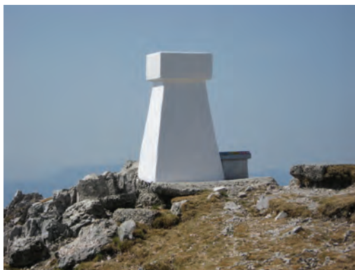
Slika 1: Trigonometrična točka I. reda 515 (Košuta) pred sanacijo in po njej.