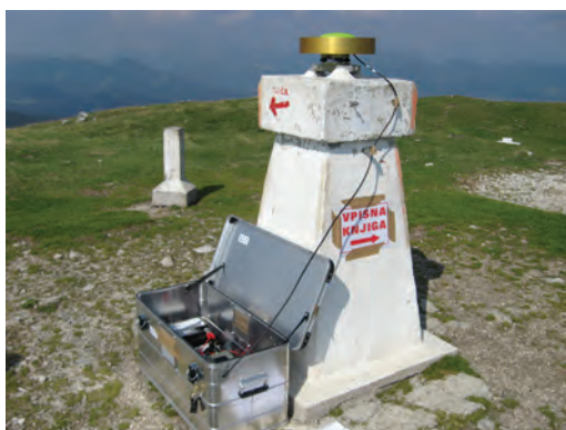
Slika 4: Meritve na točki Blegoš.

Meritve so potekale brez večjih zapletov, vreme nam je bilo večinoma naklonjeno (sliki 4 in 5), čeprav se je že pojavil prvi sneg (slika 6). V posamezni ekipi sta bila od dva do štirje člani, odvisno od zahtevnosti dostopa do točke. Prvo serijo meritev smo opravili v severovzhodnem delu države in nadaljevali v visokogorju. Za točki Kanin in Mangart je bil organiziran helikopterski prevoz članov skupine in opreme, saj je dostop do njiju zelo zahteven (slika 7).