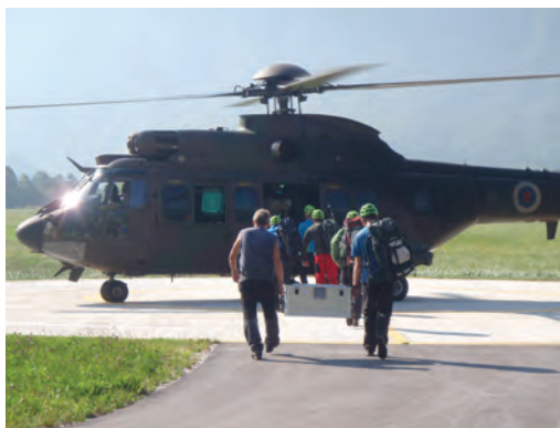
Slika 7: Helikopterski prevoz opreme in operaterjev na Kanin in Mangart.

Med meritvami so nas na točki Debeli vrh obiskali člani Dolenjskega geodetskega društva (slika 9), na točki Malija pa člani Primorskega geodetskega društva.