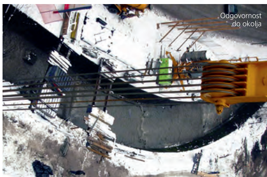
Odgovornost do okolja