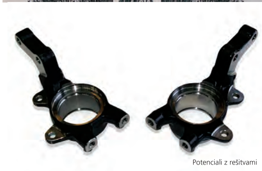
Potenciali z rešitvami